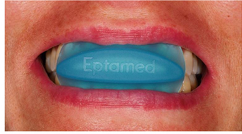
NIKI 2 - adulti